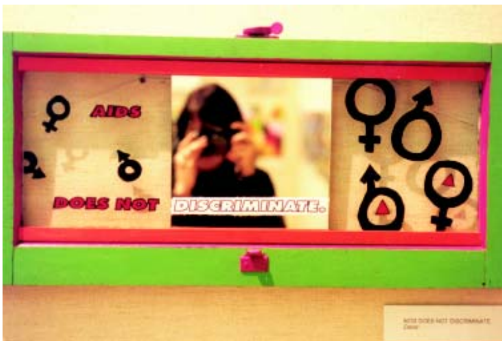
Abb. 3: Aids ist nicht diskriminierend