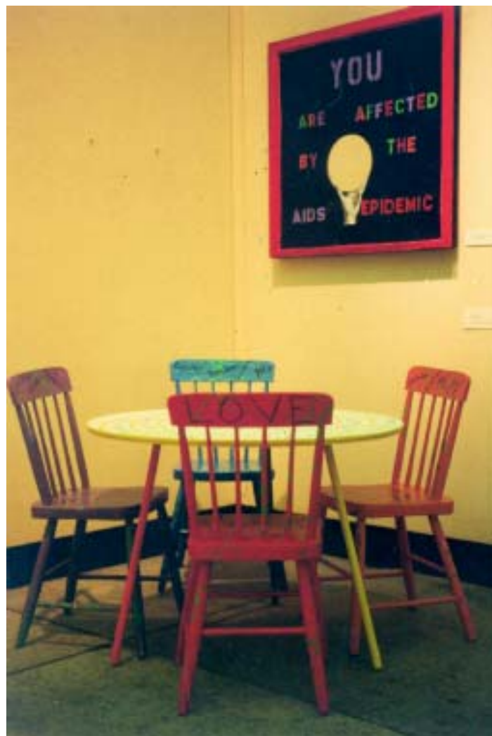
Abb. 4: Tisch und Stühle